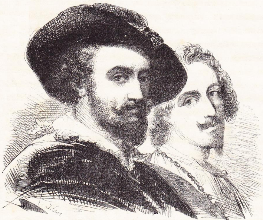
RUBENS EN VAN DYCK.

De schoone kunsten verspreidden nu over ons vaderland de rykste stralen des roems : de naem van Rubens klonk dan reeds door