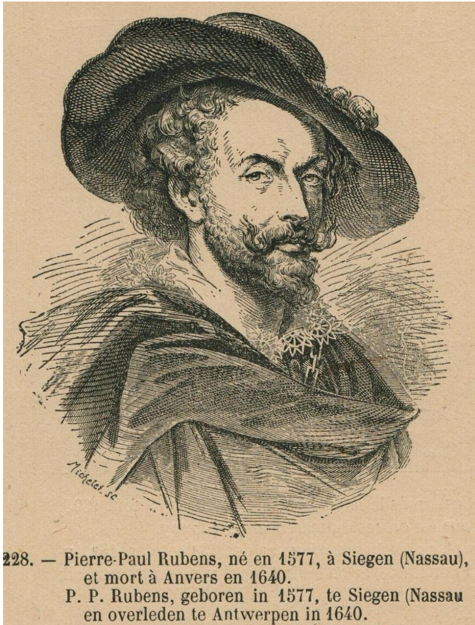
228. — Pierre-Paul Rubens, né en 1577, à Siegen (Nassau), et mort à Anvers en 1640. P. P. Rubens, geboren in 1577, te Siegen (Nassau en overleden te Antwerpen in 1640.

à la page 124 de SEVERIN , Histoire de la Belgique en images / Geschiedenis van België in prenten (1906 ?).