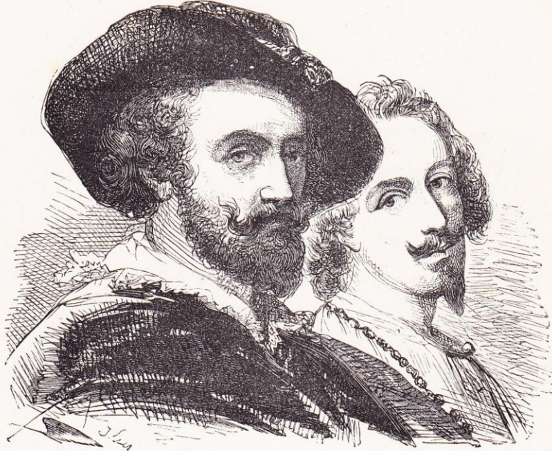
P.-P. RUBENS (1577-1640) — ANT. VAN DYCK (1599-1641).

Les beaux-arts répandaient sur nos provinces un éclat plus vif encore que les