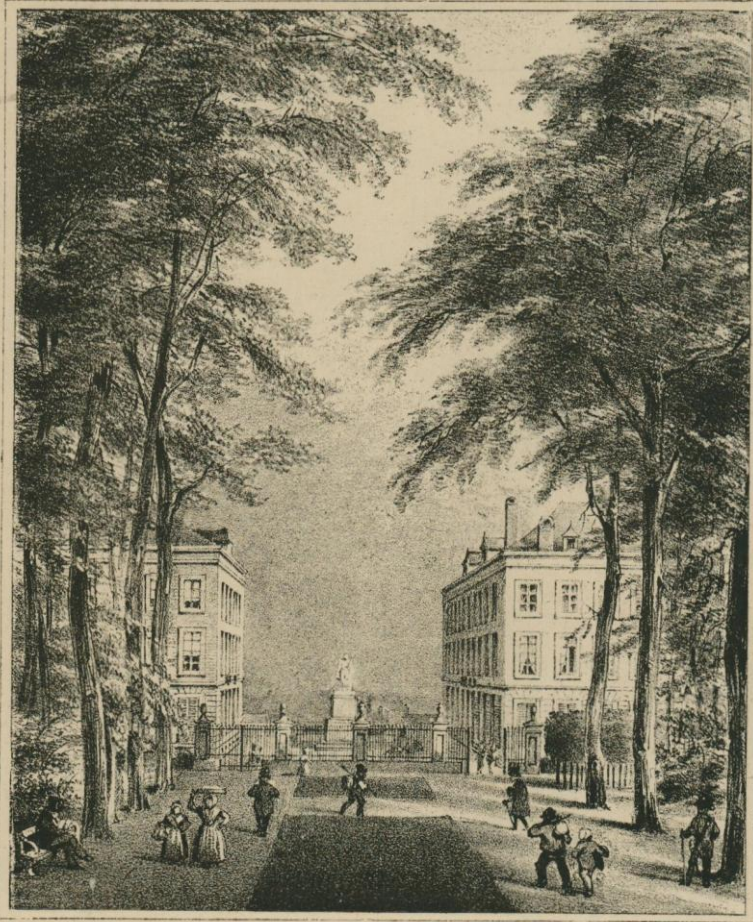
PERSPECTIVE DU PARC AVEC L'EMPLACEMENT DE LA STATUE BELLIARD. Lithographie de Borremans et de Baugnet.

Le 4 mars 1832, les souscripteurs s'assemblèrent dans la salle du Vauxhall, qui servait à cette époque indifféremment de salle de concert, de salle de spectacle et de lieu de réunion pour les sociétés et les « meetings ». Une commission fut élue, chargée de déterminer la forme et l'emplacement du monument. Elle se composait de MM. le comte Vilain XIII, Rouppe, Ch. de Brouckere, Meeus et le comte d'Arshot. Un concours fut ouvert. Les dessins et les plans de M. Guillaume Geefs furent adoptés, et en 1838, la statue du général