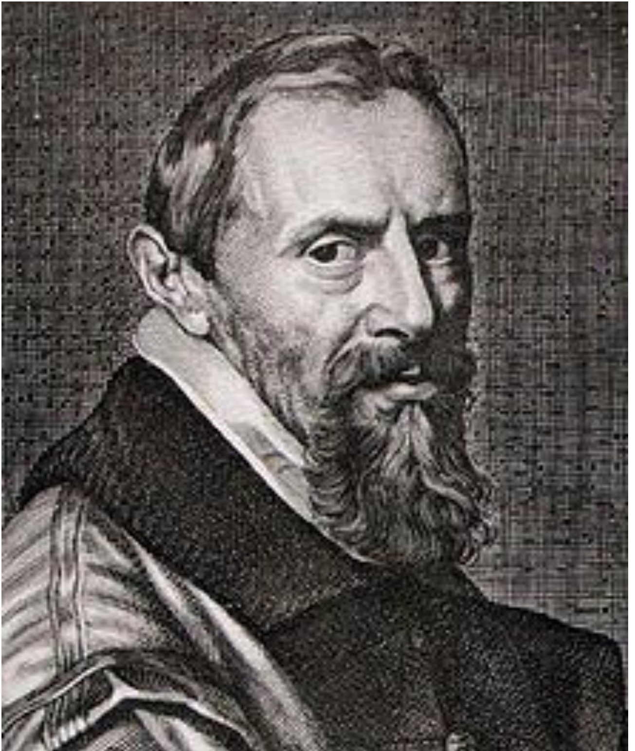
Portrait of Aubertus Miraeus (1573-1640) Gravure ancienne (Paulus Pontius naar Van Dyck in Rijksmuseum)

https://www.rijksmuseum.nl/nl/collectie/RP-P-1906-738