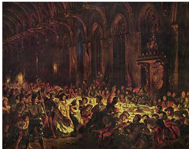
Eugène Delacroix, L'Assassinat de l'évêque de Liège

par Sirach Matthews — Travail personnel, CC BY-SA 3.0 : https://commons.wikimedia.org/w/index.php?curid=19431740