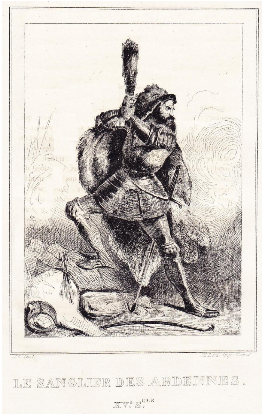
“le sanglier des Ardennes” gravure 26 , illustration entre pages 88 et 89, dans COOMANS aîné, Histoire de Belgique .

de-fer ), il confiera la gravure de ses dessins à des tiers. Ce sera aussi le cas au moins pour ceux relatifs à la Révolution Française.