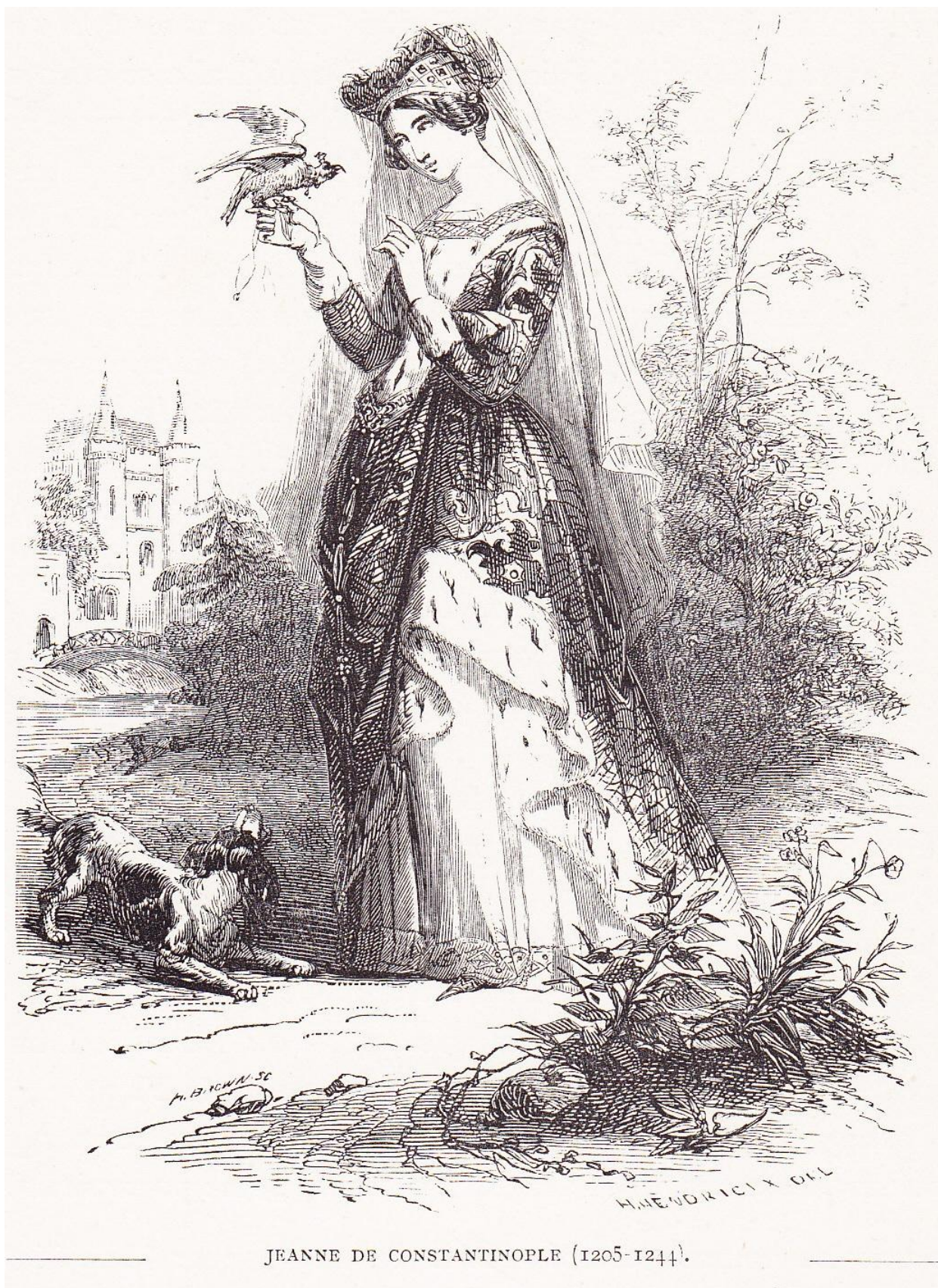
JEANNE DE CONSTANTINOPLE (1205-1244).