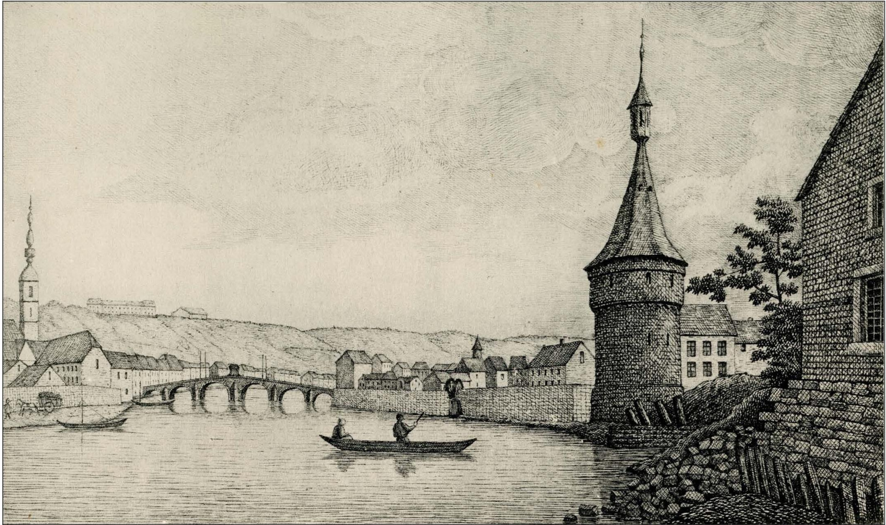
LA TRAVERSÉE DE BÈCHE EN 1815.