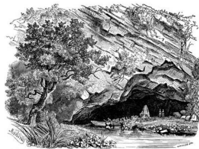
Entrée de la grotte de Han.