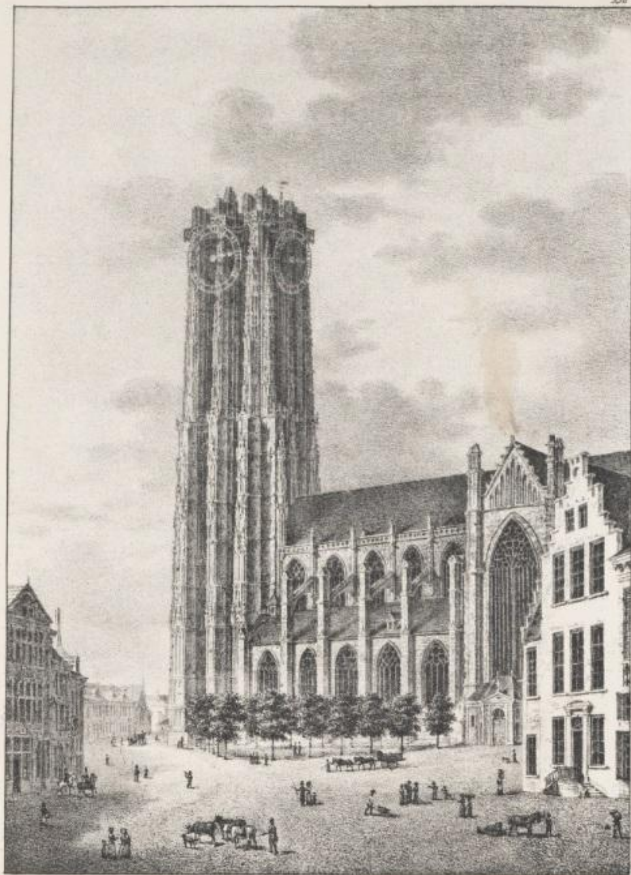
Eglise de S t Rombaut à Malines