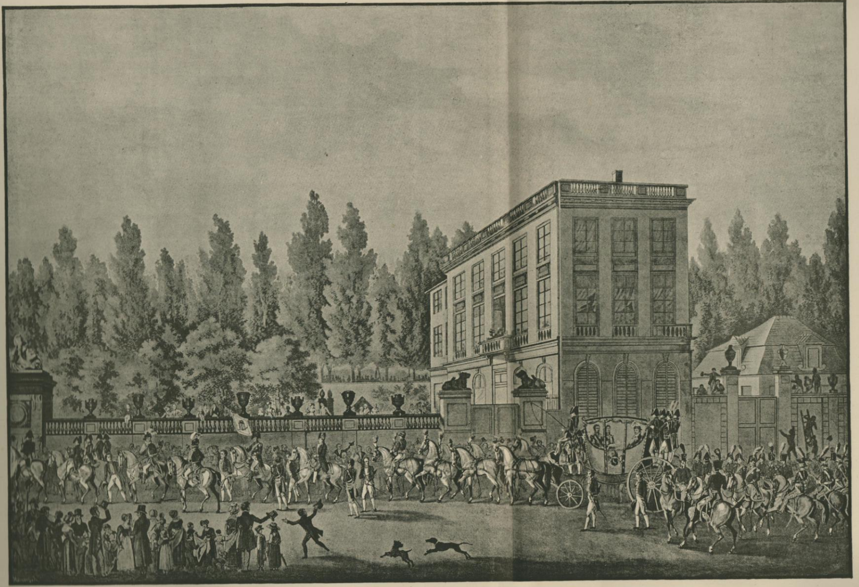
L'INAUGURATION DU ROI GUILLAUME I er , A BRUXELLES. — Fac-simile d'une planche appartenant à M. A. Outtelet.