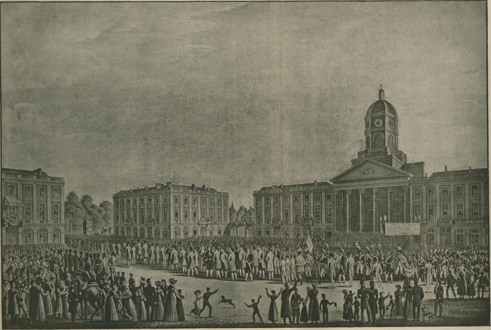
L'INAUGURATION DU ROI GUILLAUME I er , A BRUXELLES. — Fac-simile d'une gravure appartenant à M. A. Outtelet.