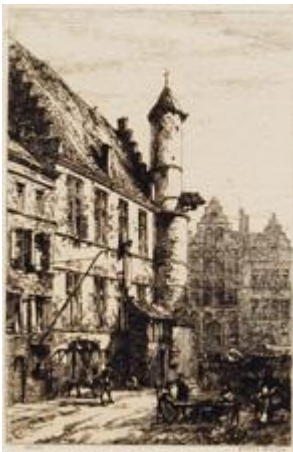
GHENT House of Alva