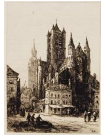
GHENT St. Nicholas and the Belfry