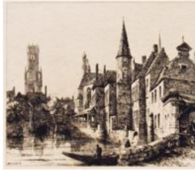
BRUGE Canal, with Tower of Boucherie in distance