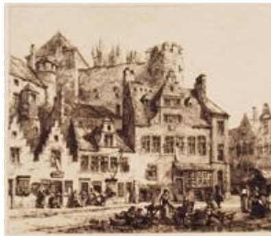
GHENT Castle of Ghent