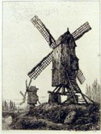
BRUGE Windmills on Ramparts