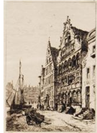
GHENT The Hall of the Watermen's Guild