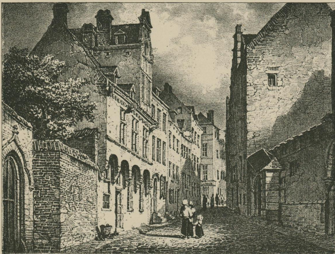
PETITE RUE DE SAINT-LAURENT (actuellement rue Ravenstein). — Fac-simile d'une lithographie de T. S. Cooper.

Cet incendie avait fait des ravages bien plus considérables que celui du 6 décembre