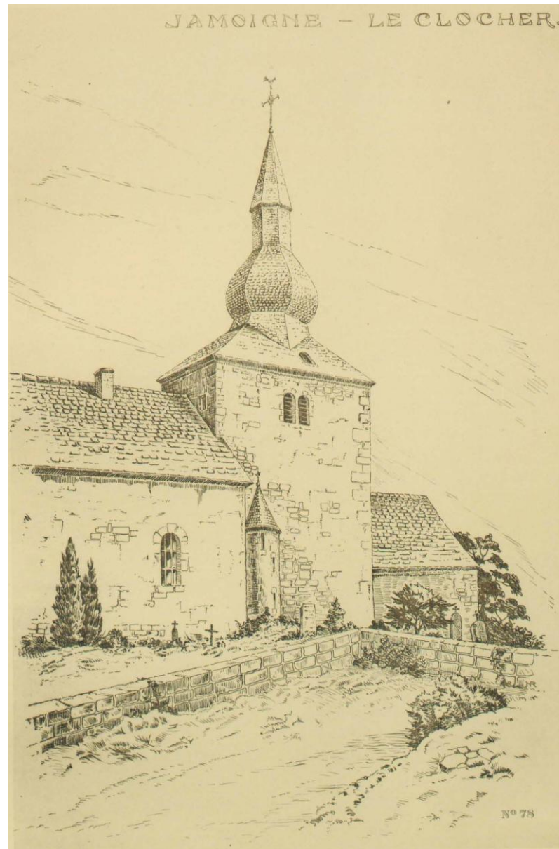
JAMOIGNE - LE CLOCHER.