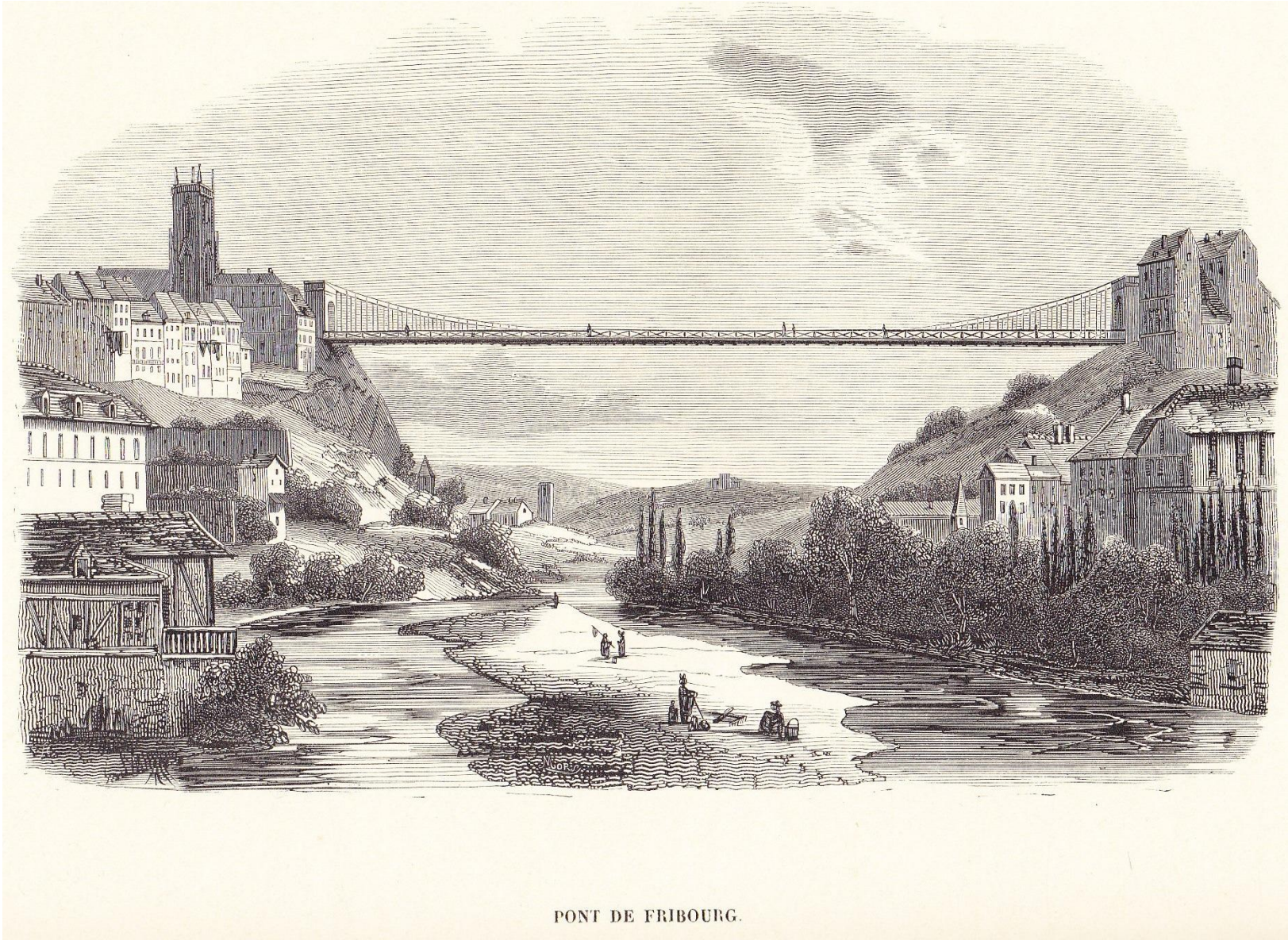
PONT DE FRIBOURG.