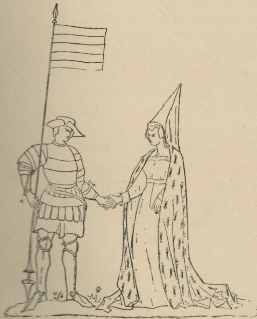
Arnould, sire de Diest, burgrave d'Anvers, épousa Isabeau de Mortagne.