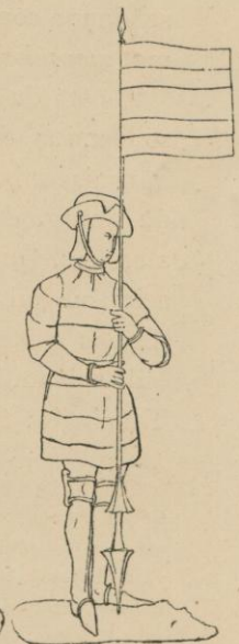
Thomas II, sire de Diest, burgrave d'Anvers.