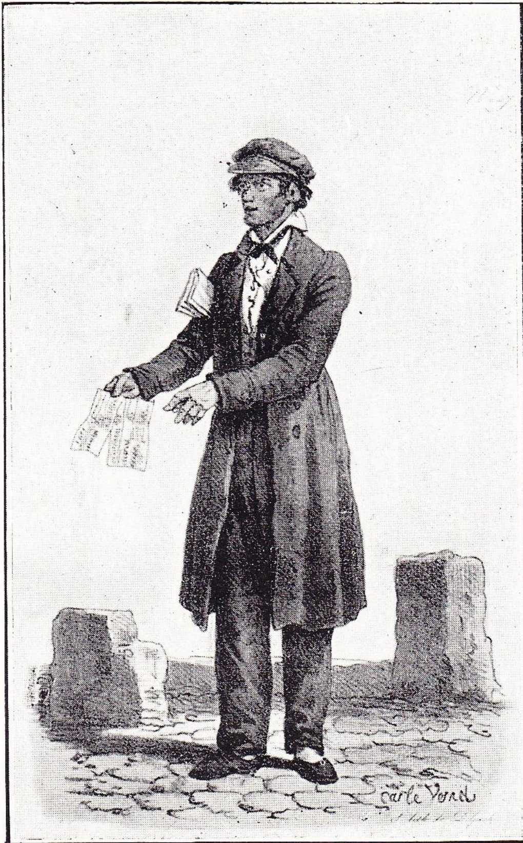
LE MARCHAND DE BILLETS DE LOTERIE. LES PETITS MÉTIERS DE PARIS, par CARLE VERNET.