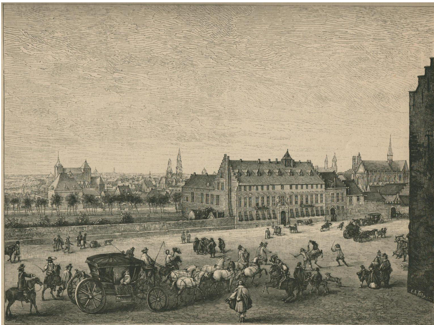
L'ANCIEN HÔTEL DE BOURNONVILLE.

Situé sur l'emplacement de l'hôtel actuel de M. le comte de Mérode-Westerloc, rue aux Laines. — Cette gravure est faite d'après un tableau appartenant à M. le comte de Mérode et dont une copie existe chez M. le marquis de Laboëssière-Thiennes. — Il y a quelque lieu de supposer que les figures du tableau original sont de Teniers.