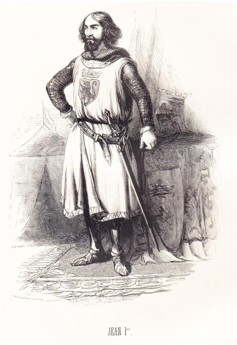
JEAN I er .