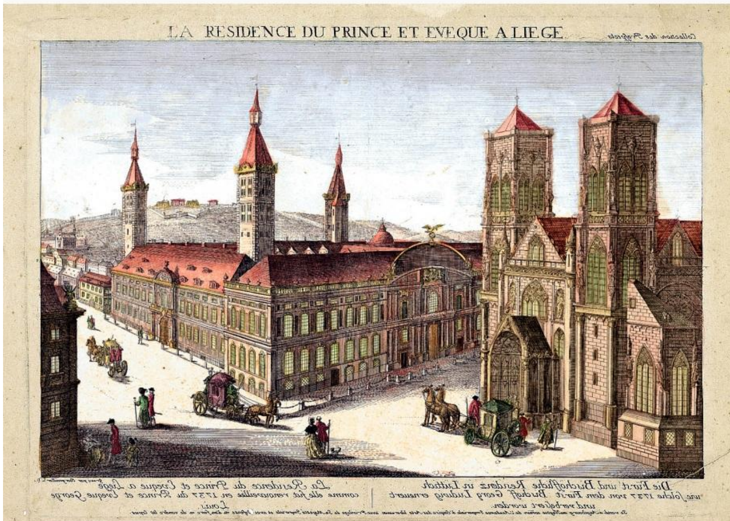
La résidence du Prince et Eveque à Liege eau forte coloriée de Johann Bergmuller. Vue d'optique inversée destinée à la projection à la lanterne

http://www.chokier.com/FILES/STLAMBERT/Icono.html