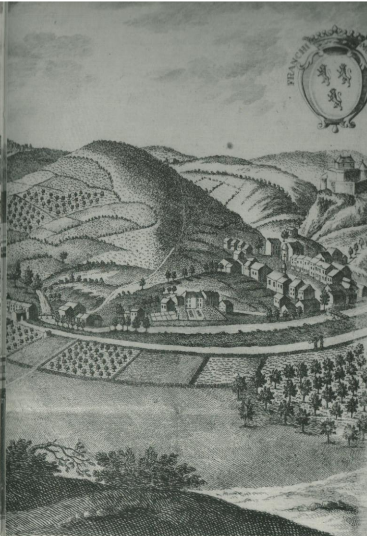
The Country-Town of Theux and the Castle of Franchimont four Miles from Spa