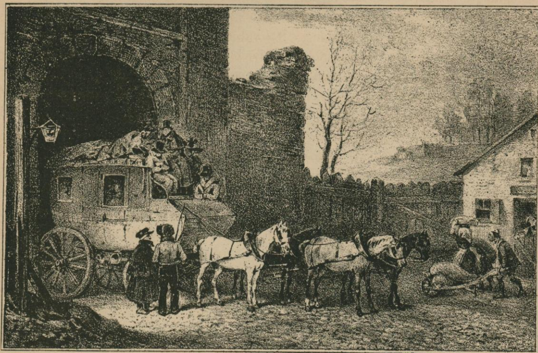
ENTRÉE D'UNE DILIGENCE A BRUXELLES, vers 1820. — Dessin de Madou.

« Mais la civilisation, fille du temps, le suit dans sa marche impitoyable. Bruxelles n'est pas encore ce qu'il sera dans vingt ans. Vous regardez ces inventions nouvelles que le génie de l'industrie greffe sur les vieilles inventions, celles d'hier; voyez comme les riches magasins de l'an passé pâlissent devant les magasins de la semaine der-