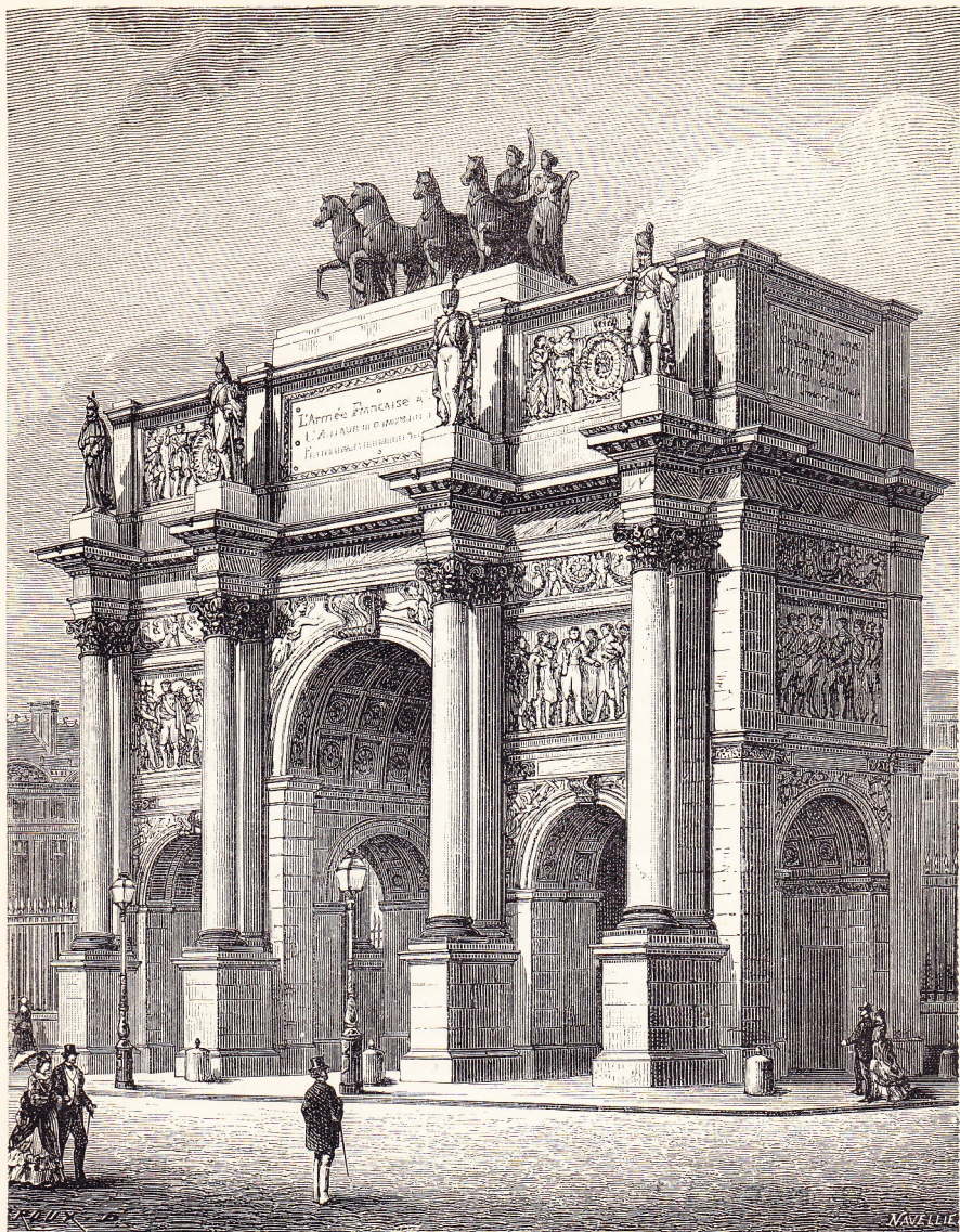
L'arc de triomphe du Carrousel (1806).