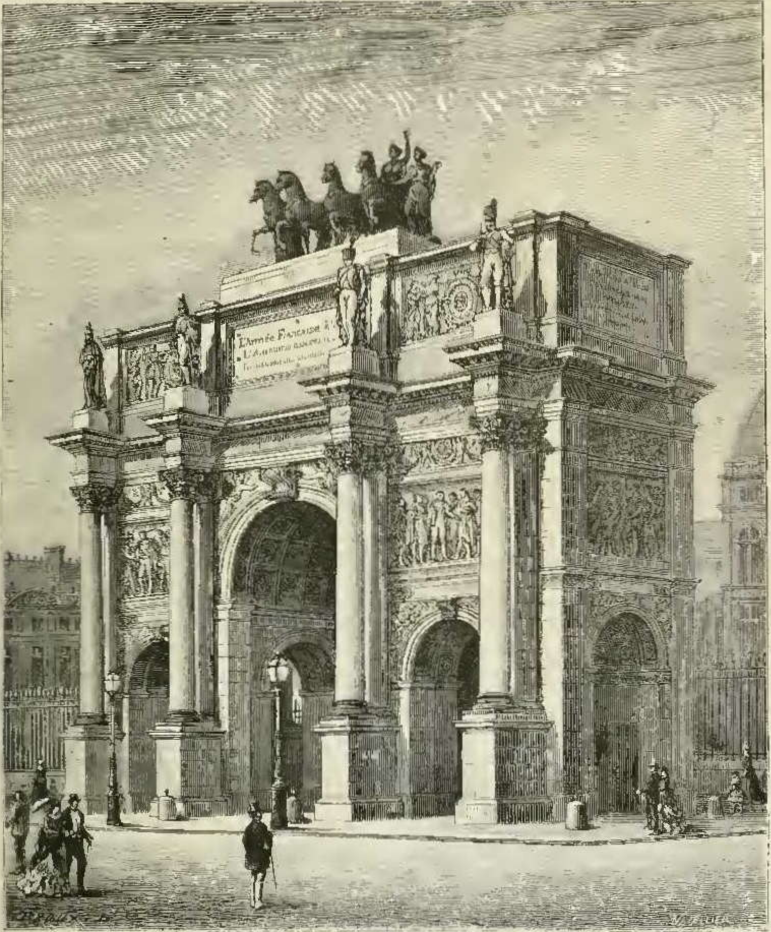
Arc de Triomphe du Carrousel.

abaissée et vaine. C'est au delà du Rhin qu'on trouvait maintenant les philosophes et les poètes, les successeurs de Voltaire, de Rousseau, de Buffon, en même temps que ces grands musiciens qui sont, dans leur art, les égaux des grands architectes français du Moyen-âge et des grands peintres italiens de la Renaissance.