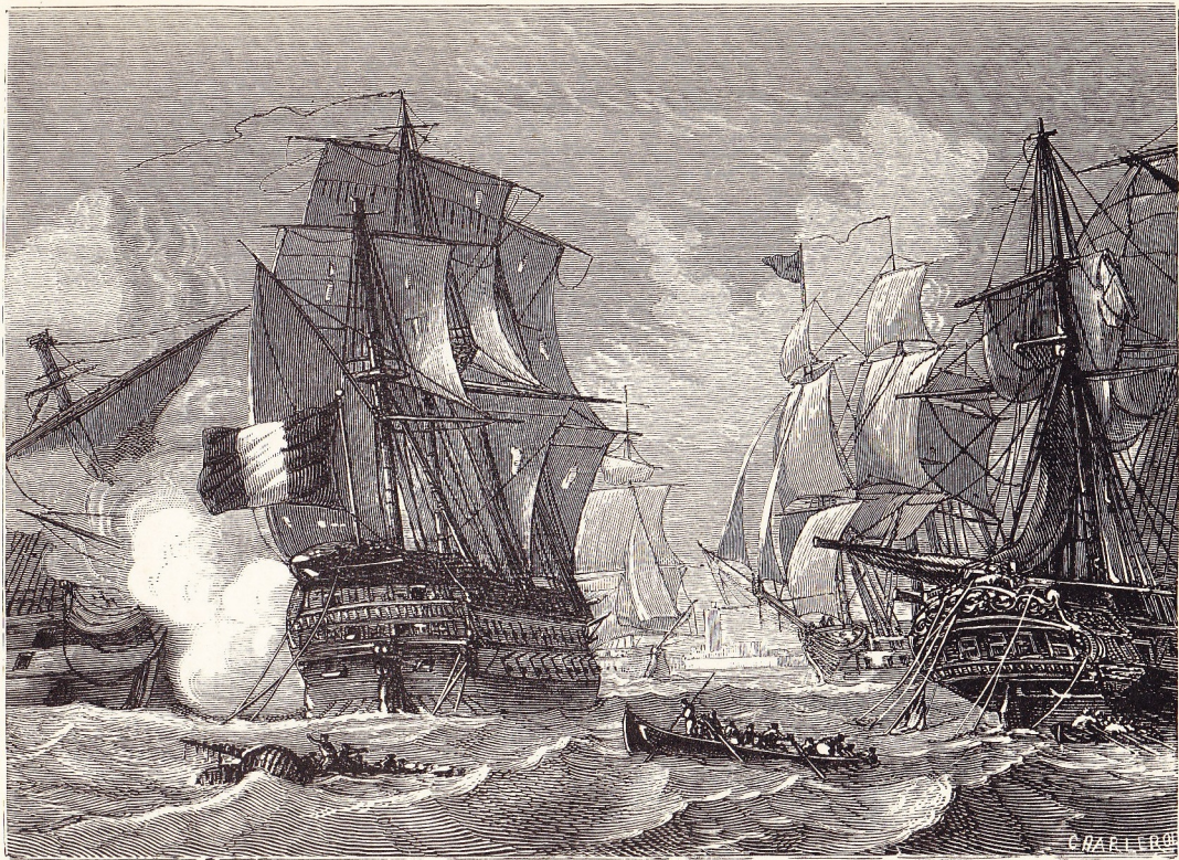
Combat du Formidable (capitaine Troude) (juillet 1801).