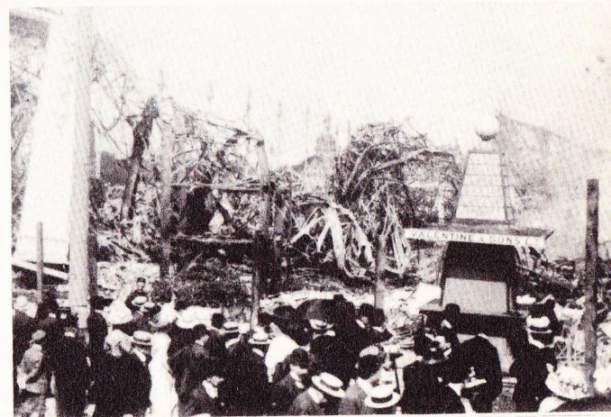
EXPOSITION 1910 : EN FÊTE. NATURE MORTE. APRÈS L'INCENDIE