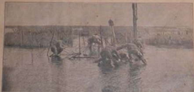
MET DOORSNIFFEN VAN FRIGATELOOZIG IN HET «NEMANDELAND»

Uitgever J. HOSTE, 36, St-Pieterstraat, Brussel