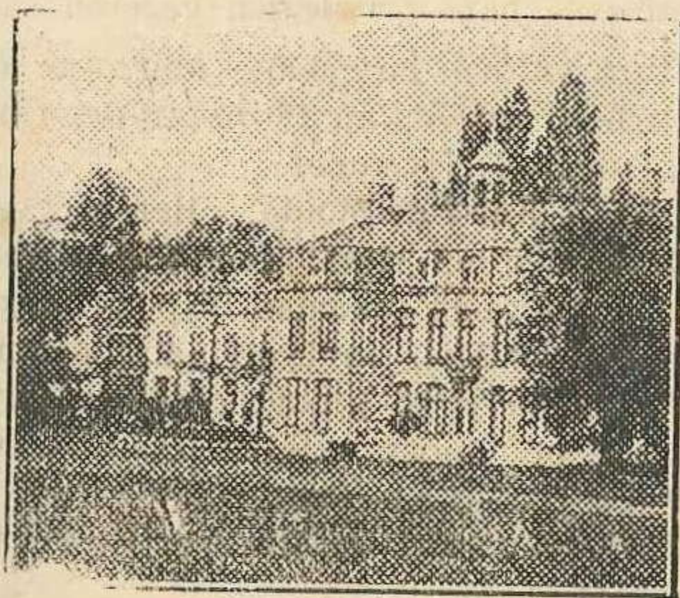
Het kasteel van 't Hooge, te Zillebeke