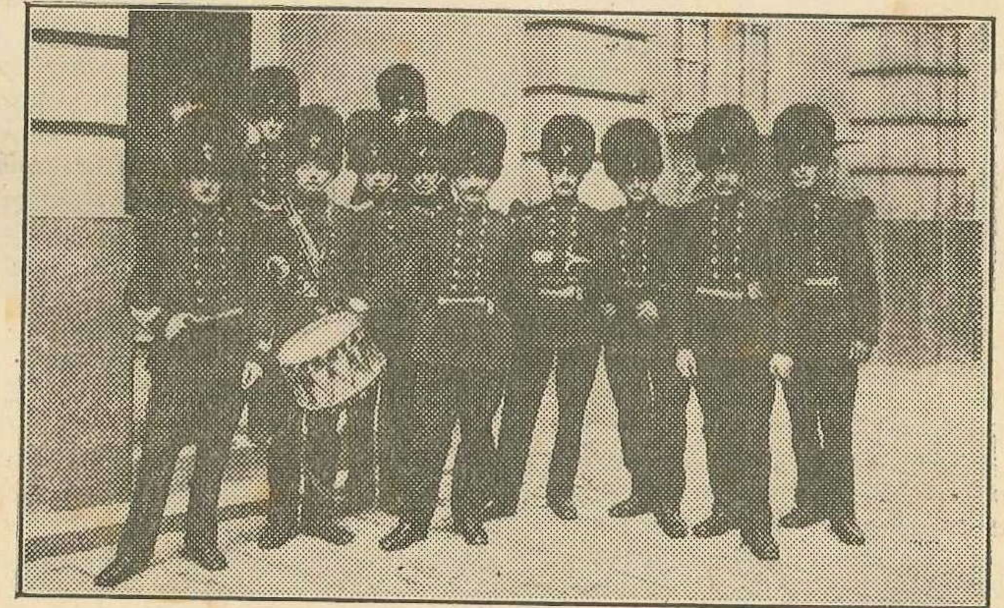
De uniformen van 1914 Grenadiers, die zich onder meer bij Tervate onderscheidden

Den 27en, 's Dinsdags, in den namiddag, om vier uur, vertrok Kogge met de