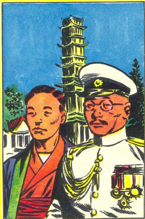
EEN MODERNE VORST

M UTSUHITO, keizer van de Méidji-tijd, was gestorven in 1912. Zijn zoon Josjihito was hem opgevolgd, maar om gezondheidsredenen gaf hij de teugels van het bewind aan zijn zoon Hirohito, die nauwelijks 20 jaar oud was. Deze werd in 1926 de 124e mikado van het Land van de Rijzende Zon. Hij was een keizer van de oude stempel, d.w.z. dat hij in de ogen van zijn landgenoten een godheid was. Nochtans was Hirohito geen dictator.