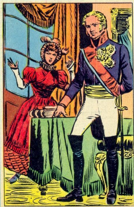
2. — VEELKOPPIG

CLEMENS W.L., vorst van Metternich-Minneburg, kanselier van het Oostenrijks-Hongaars keizerrijk zou gedurende vijftien jaar de scheidsrechter van Europa zijn. Hij beheerste voor een groot deel de Europese politiek en dat in een geest van starre behoudzucht. Om Europa in het « ancien régime » te houden, stichtte hij wat men zou kunnen heten « een onderlinge bijstand voor koningen ». Dat was de Heilige Alliantie.