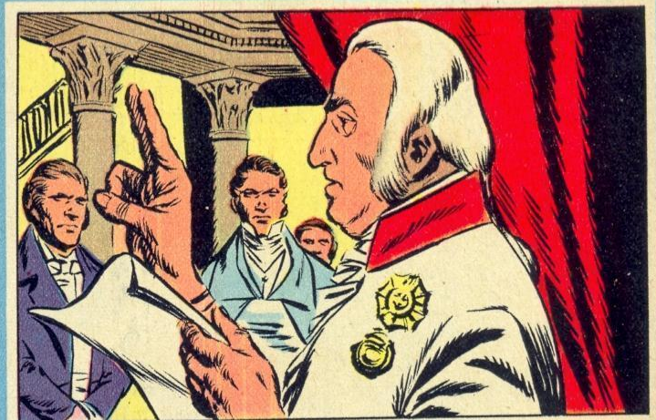
4. — DE DRAAK IN ITALIE

OM de nationale en liberale beweging te bestrijden, paste Metternich het principe toe van de interventie. In 1818 kwam het Congres van Aken bijeen en daar werd Frankrijk opgenomen in de Heilige Alliantie. Op dit ogenblik manifesteerden de Duitse studenten te Jena en te Mannheim. Een van hen, Karl Sand, stak de dichter Kotzebue neer omdat hij kritiek had uitgeoefend op de liberalen. In 1819 kwam het Congres te Karlsbad bijeen en Pruisen kreeg de opdracht de orde te handhaven.