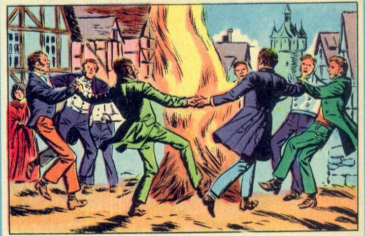
3. — DE DRAAK IN DUITSLAND

HET doel van Metternich was het pact van Chaumont, d.w.z. de vierdubbele alliantie, zo lang mogelijk te bewaren: Oostenrijk, Rusland, Engeland, Pruisen. Hij wou zelfs Frankrijk in de alliantie opnemen. Het idee er een « mystieke unie » van te maken kwam van de tsaar en was geïnspireerd door barones von Krüdener, een Russische dame, vroom, idealistisch maar toch een tikje raar. In naam van de Heilige Drievuldigheid bundelde men het katholieke Oostenrijk, het protestantse Pruisen, het orthodoxe Rusland en het anglicaanse Groot-Brittannië. En dit alles om de kop van de draak te verpletteren !