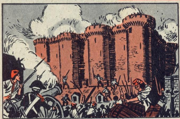
2. — OP 14 JULI