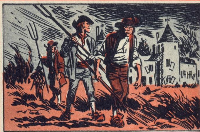
4. — LEVE DE NATIE

N A de parlementaire revolutie van Versailles, kwam dus de populaire revolutie van Parijs. De koning aanvaardde alles. Hij ging naar het stadhuis van Parijs en droeg de driekleurige cocarde van het nieuwe Frankrijk: blauw en rood, de kleuren van Parijs, en wit, de kleur van de koning. Parijs kreeg een gemeenteraad, voorgezeten door Bailly en een nationale garde gecommandeerd door La Fayette.