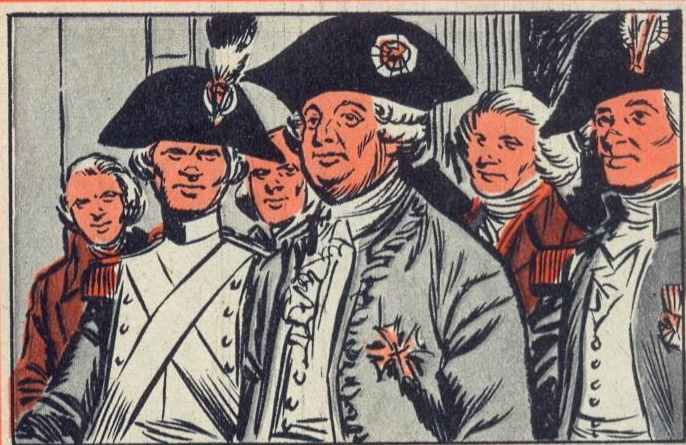
3. — IN HET STADHUIS

H ET volk greep naar de wapens en bestormde de Bastille. De Bastille was een Staatsgevangenis, waarin mensen werden opgesloten bij de z.g. « Lettre de cachet » (gezegeld papier). Het was een blanco volmacht van koninklijk zegel voorzien, waarop de houder de naam kon invullen van diegene welke hij in de gevangenis wilde laten zetten. De Bastille was het symbool van het despotisme en werd door het volk veroverd. Dat was op 14 juli sedertdien Franse Nationale Feestdag.