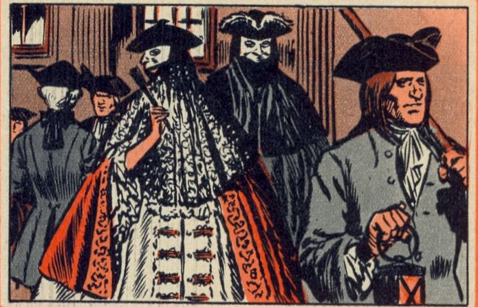
3. - CARNAVALS

D E XVIII e eeuw was nauwelijks begonnen, toen de schilder Jean-Antoine Watteau de Rococo in de schilderkunst bracht. Hij konterfeitte kleine, lieflijke schilderstukjes voor salons, heel vaak landelijke of galante toneeltjes in de verrukkelijkste kleuren. De figuren waren mooi, schalks, maar ook oppervlakkig. Watteau kreeg in Frankrijk volgelingen met talent: Nattier, Boucher, Quentin de la Tour, Chardin en vooral Fragonard. De Engelse school bracht in die tijd meesterwerken voort in zachte portretkunst. De grootste virtuozen waren Gainsborough en Reynolds.