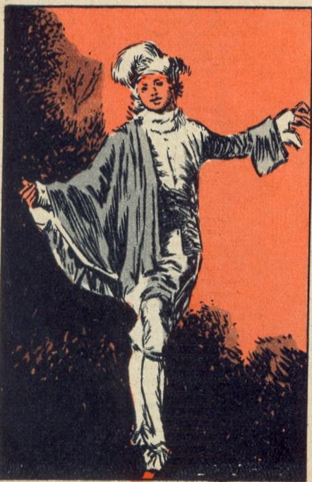
2. - LIEFLIJKE SCHILDERIJEN

I N de XVIII e eeuw was de burgerij rijk genoeg om zich van de kunst meester te maken. En de kunst, tot dan toe gereserveerd voor de paleizen, diende voortaan om de huizen mooier te maken. Het was de triomf van het kleine: kleine boudoirs, kleine meubels, kleine spiegels, kleine snuifdozen en porseleinen figuurtjes. Iedereen was dol op het porselein van Doornik, Saksen en Sèvres, en op het aardewerk van Delft, Straatsburg en Nevers.