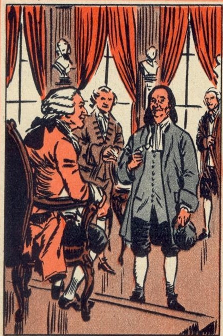
2. - DE HULP VAN FRANKRIJK

H IJ was toen zeventig jaar oud en een typische « self-made man ». Hij werd geboren te Boston als zestiende kind van arme ouders. Hij was eerst leerling in een ververij, journalist toen hij pas zeventien was en auteur van de « Poor Richard's Almanack », waarmee hij zijn roem als schrijver vestigde. Hij was filosoof, natuurkundige en, zoals je weet, de uitvinder van de bliksemafleider. Franklin ontpopte zich als diplomaat en vertrok naar Versailles.