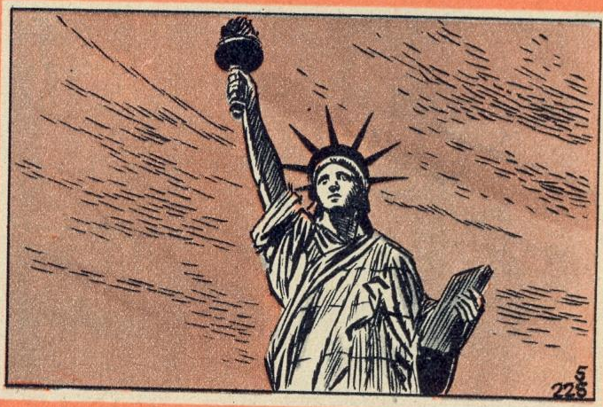
5. - VRIJHEID

E EN hele reeks vredesverdragen werden ondertekend, in het voordeel van Spanje, van Holland en vooral van Frankrijk. De Fransen namen weerwraak op het verdrag van Parijs. zij kregen Senegal terug en ook de visserijen van New Foundland. Op 19 april 1783, besloot Engeland er toe de onafhankelijkheid van de Verenigde Staten van Amerika te erkennen!