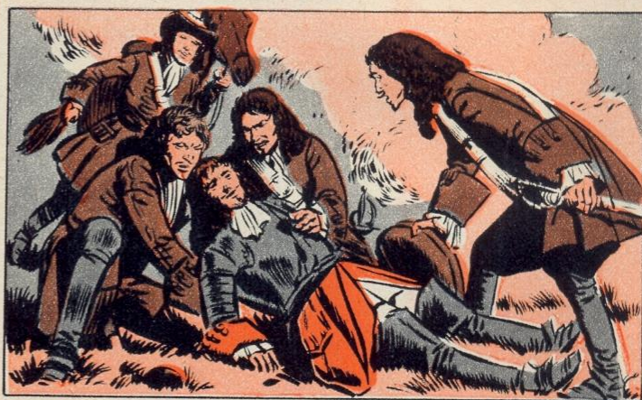
3. — HET SLAGVELD

L ODEWIJK XIV kon het niet verdragen dat de « Republiek van Kooplui », zoals hij Holland noemde, hem schaakmat had gezet. Het belang van Frankrijk duldde het trouwens niet. Had Holland niet het Colbertisme tot eigen profijt toegepast? Het had de produktie in eigen land aangemoedigd en z'n grenzen gesloten voor de Franse waar! Men zou dit verbod breken met kanonvuur en men moest daarom een tweede oorlog beginnen, een oorlog tegen Holland. En weer stond Europa in brand.