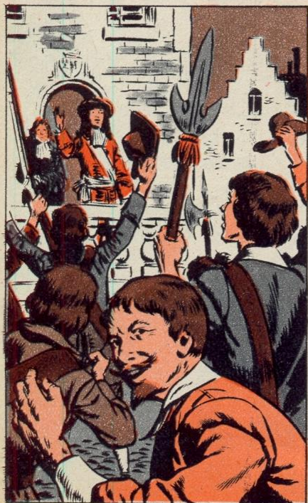
2. — WILLEM III