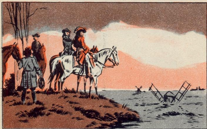
1. — DE OORLOG TEGEN HOLLAND