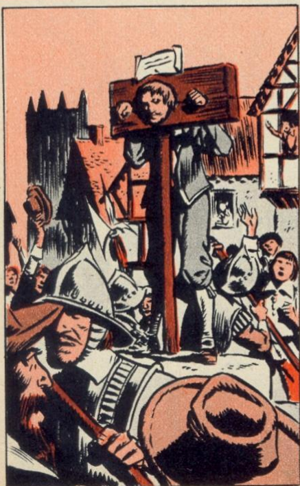
2. — DE KRACHT-PROEF

KAREL I werd met welwillendheid begroet omdat hij mooi en waardig was, maar hij was ook hoogmoedig, autoritair, en niet van zijn eerste leugentje gebarsten. Hij had veel geld nodig om de nutteloze hulpexpeditie naar La Rochelle te betalen. In 1625 vroeg hij aan het Parlement nieuwe subsidies te stemmen. Maar de afgevaardigden herinnerden hem aan de « Magna Charta Libertatum » of « Groot Handvest van de vrijheden », dat de onderdanen tegen de willekeur van de vorst beschermde. Toen besloot de koning zonder Parlement te regeren!