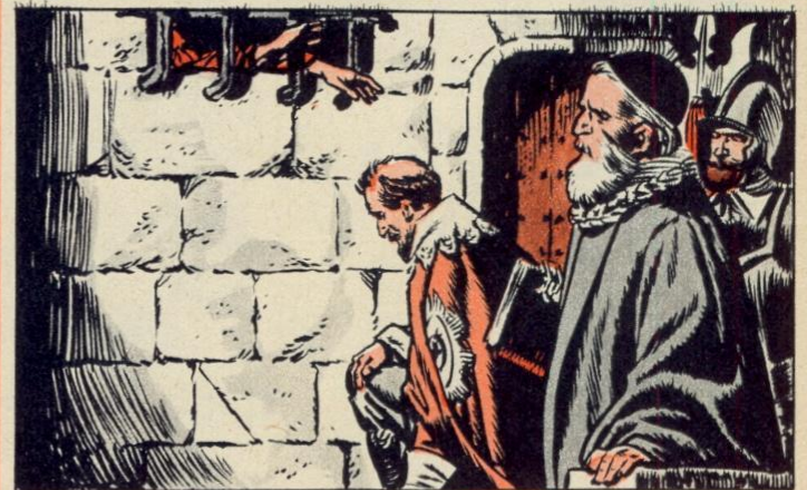
4. STRAFFORD ONTHOOFD

UIT de opstand groeide een burgeroorlog. De Schotten brachten troepen op de been en drongen Engeland binnen. De koning was toen wel verplicht het Parlement samen te roepen. De afgevaardigden stemden de aanhouding van Strafford en van Laud. Strafford werd ter dood veroordeeld en onthoofd. Van uit zijn cel zond Laud hem zijn zegen, maar de koning slaagde er niet in Strafford te redden.