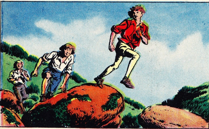
1. — EEN SOLDAAT

HENDRIK IV belegerde Parijs. Ondanks de nijpende honger bood de hoofdstad dapper weerstand. Toen kwam Philips II tussenbeide. Hij stuurde Alexander Farnese, gouverneur-generaal van de Nederlanden, naar Parijs om de stad te ontzetten. Philips II verdedigde zoals gewoonlijk het katholicisme, maar... hij droomde er van Infante Isabella, zijn eigen dochter, op de troon van Frankrijk te zetten!