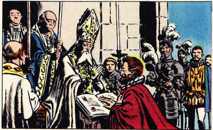
4. — DE DODENSPRONG

IN 1589 had Hendrik IV geen hoop erkend te worden als koning van een Frankrijk waar de katholieken de meerderheid hadden en al de grote steden, Parijs inbegrepen, in de hand hielden. Maar Hendrik IV was een man. Als kind had hij blootvoets gelopen met de herders in de bergen van Bearn — vandaar ook zijn bijnaam — hij had aldaar gezondheid, energie en een goed humeur opgedaan. Hij was een man en hij was een soldaat!