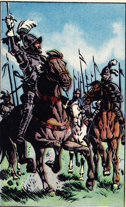
2. — EEN WITTE VEDERBOS

TOEN besloot Hendrik IV eensklaps opnieuw katholiek te worden. Heeft hij gezegd «Parijs is wel een mis waard»? Of sprak hij over een «dodensprong»? In ieder geval zwoer hij het protestantisme af op 13 juli 1593 in de basiliek van Sint-Denis. De Liga viel uiteen, Parijs opende haar poorten en de Spanjaarden maakten zich uit de voeten. «Groet uw meester, zei de koning tot hen, maar kom hier niet meer terug!»