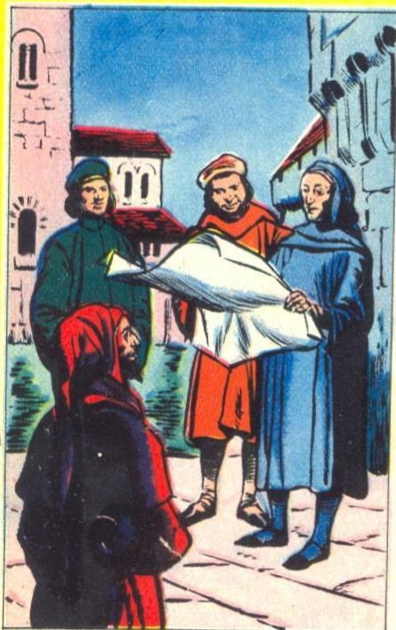
1. — TE FLORENCE IN 1300

V ITA NUOVA is Italiaans. Het wil zeggen nieuw leven en het is de titel van een beroemd boek van Dante. De eerste titel van dit boek was geschreven in het Latijn, « Vita Nova ». Dante Alighieri werd geboren te Florence in 1265 en stierf in 1321. Hij is de grootste dichter van Italië, een der verhevenste geesten van de wereldliteratuur en is als denker een sluitfiguur van de Middeleeuwen. Het is de tijd van Dante die voor Italië en voor de wereld een nieuw leven bracht.