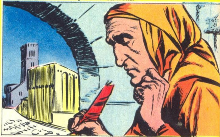
4. — HYMNE AAN HET LEVEN

DANTES jeugdlyriek cirkelde om de lieflijke gestalte van de jong gestorven Beatrice, die hij als negenjarig kind voor het eerst ontmoette. Dante hield van Beatrice, maar deze wist daar helemaal niets van. Volgens de enen stierf zij heel jong, volgens de anderen is het niet zeker dat zij ooit heeft geleefd, tenzij dan in de geest van Dante. Hoe het ook zij, de dichter bezong Beatrice in zijn vele canzoni.