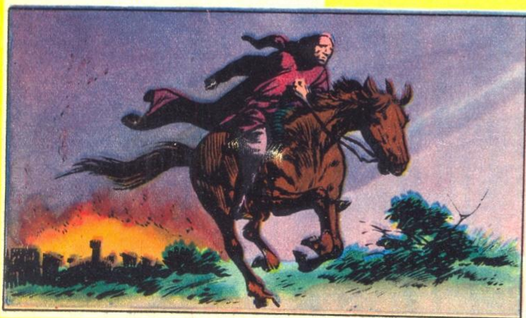
2. — DE WITTEN EN DE ZWARTEN

IN gedachten verzonken liep hij langs de huizen op de « ponte Vecchio », de brug over de Arno, als iemand hem groette : « Dag, Dante Alighieri ! » Het was de architect Arnolfo di Cambio, die grote perkamentrollen droeg. « Zijn dat de plannen voor het nieuw paleis of voor de nieuwe dom ? » vroeg Dante. « Voor alle twee, mijn waarde ! Kijk, ik toon ze je. » Terwijl de dichter de groots opgevatte plannen bewonderde, naderden twee schilders. Het waren Giotto en Cimabue. Zij groetten Dante en de architect. « Florence wordt een grote stad ! » zei Dante. — « Jij bent een der zes prioren van die stad ! »