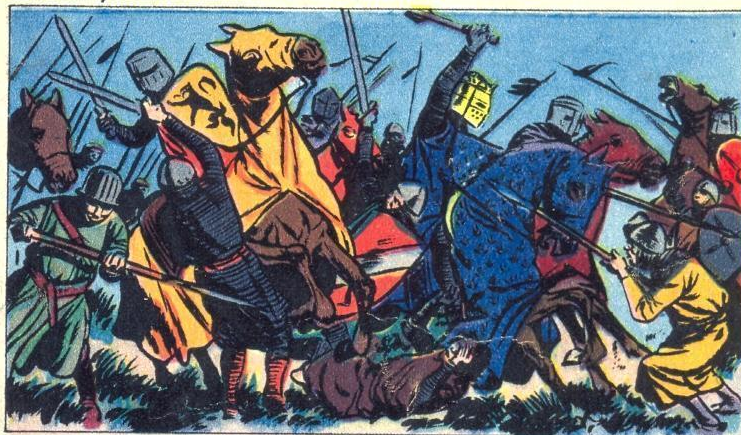
4. - MEME DANS LA GUERRE

SAINT LOUIS aimait la paix. Pour empêcher ses vassaux de se livrer des guerres privées, il fit respecter la Trêve de Dieu qui interdisait les guerres les jours de fête, du Carême, de l'Avent et aussi la Quarantaine du Roy, qui imposait quarante jours de répit avant les hostilités, de quoi oublier la querelle. Pendant ce temps, il essayait de réconcilier les ennemis.