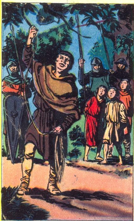
2. - « A CHACUN LE SIEN ! »

EN 1226, Louis IX n'avait pas douze ans. Sa mère prit la régence. C'était Blanche de Castille, une femme extraordinaire. Les nobles de France profitant de ce que le roi était mineur, se révoltèrent; Blanche les dompta avec énergie. Mais la gloire de Blanche fut d'avoir élevé son fils aîné de façon à faire de lui un homme et un saint. Elle fut le modèle des mères.