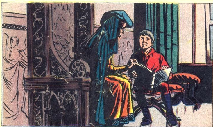
1. - BLANCHE DE CASTILLE