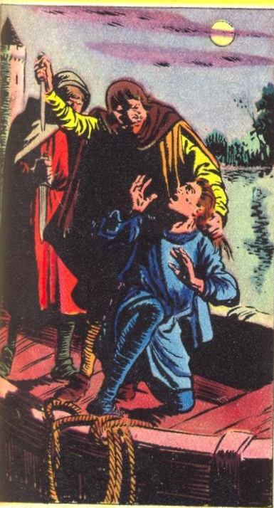
2. - RICHARD EN JAN

JAN sloot een bondgenootschap met Otto IV van Duitsland, met Renaud van Boulogne en met Ferrand van Portugal, graaf van Vlaanderen. Op 27 juli 1214 had de slag plaats te Bouvines. Het was een vreselijk gevecht. 's Avonds moest Otto IV de vlucht nemen. Ferrand was gewond en werd gevangelijk naar Parijs geslept. Philips-Augustus kwam als groot overwinnaar te voorschijn. Hij hield Normandië, Anjou en het Noorden van Guyenne.