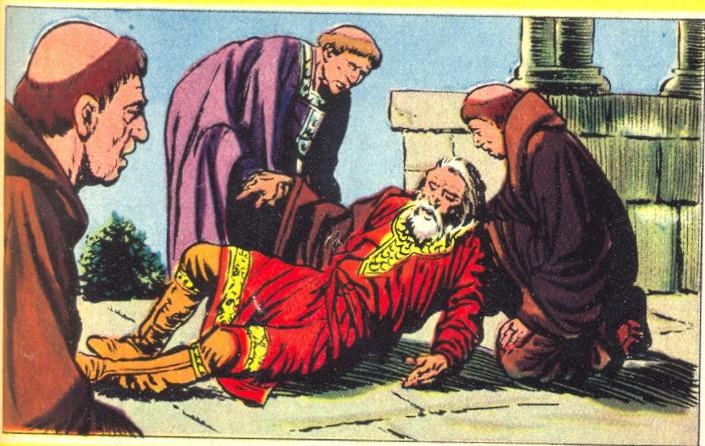
1. - HIJ HAD ER GENOEG VAN

IN 1202 verklaarde Philips-Augustus, dat Jan zonder Land geen enkel recht meer had in Frankrijk en hij viel Normandië binnen. Hij belegerde het versterkt kasteel Château-Gaillard. Het was een vreselijke onderneming, maar hij haalde na maanden inspanning de overwinning en bezette ook Rouen. Toen besloot Jan zonder Land er korte metten mee te maken.