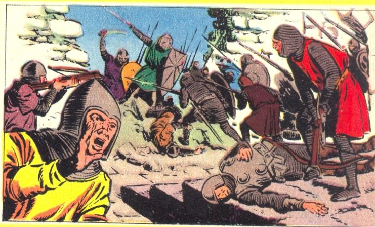
3. - DE OORLOG

DE zoon van Lodewijk VII, de jonge Philips, kreeg de bijnaam Augustus omdat hij in de maand augustus geboren werd. Hij was, naar men heeft gezegd, een koning die verstand had van politiek. De kroniekschrijvers noemden hem: « Prudens et sapiens », voorzichtig en wijs. Maar was hij dat heus? Neen. Vertaal « Prudens » door heimelijk, leugenaar, de voorzichtigheid van een serpent; en « sapiens » door vals, zonder scrupules, de wijsheid van Satan.