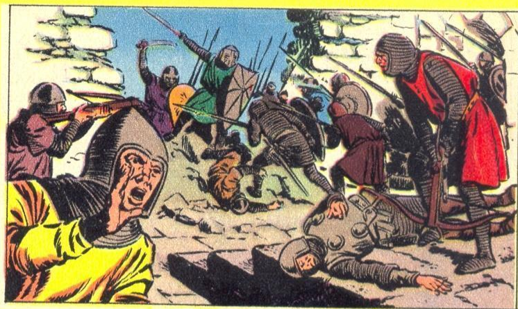
3. - « CHATEAU-GAILLARD »

L E fils de Louis VII le Jeune, Philippe II, surnommé Auguste parce qu'il était né au mois d'août, fut le plus grand politique de la maison capétienne. Un grand politique ? Oui, son chroniqueur dit : « Prudens et sapiens. » Prudent et sage, c'est cela ? Non. Traduisez : Prudens : tortueux, menteur, prudence de serpent; sapiens : fourbe, sans scrupules, sagesse du Malin.