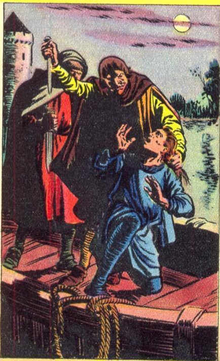
2. - RICHARD ET JEAN

IL fit alliance avec l'empereur germanique, Othon IV, avec Renaud de Boulogne et avec Ferrand de Portugal, comte de Flandre. Philippe-Auguste affronta l'armée des coalisés, le 27 juillet 1214, à Bouvines. Un corps-à-corps indescriptible ! Au soir de cette mémorable journée Othon IV était en fuite, Ferrand blessé était traîné à Paris prisonnier et « enfermé ». Philippe-Auguste vainqueur gardait la Normandie, l'Anjou et le Nord de la Guyenne !