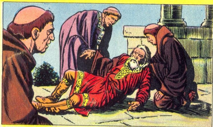
1. - MALICE

EN 1202, Philippe-Auguste fit déclarer son vassal, Jean sans Terre, félon et déchu de ses fiefs de France. Il attaqua aussitôt la Normandie, importante parce qu'elle commandait la Seine. Il assiégea aux Andelys le formidable Château-Gaillard. Un siège effarant. Il l'emporta. Oh ! après des mois d'efforts. Il prit Rouen, la capitale. Alors Jean sans Terre se décida à réagir.