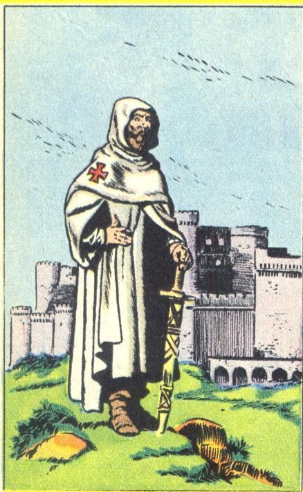
2. - DE RIDDERORDEN

HELAAS, de Christene prinsen van het koninkrijk Jeruzalem konden met elkaar niet best opschieten, hun macht verzwakte en Saladin, sultan van Egypte, organiseerde een Mohammedaans leger en versloeg de Christenen in het jaar 1187, nam de koning gevangen, liet het kruis neerhalen en opende de Mohammedaanse moskeeën opnieuw. De Christene wereld kon zich daarbij niet neerleggen en er werden nog zes kruistochten georganiseerd, zonder resultaat echter.