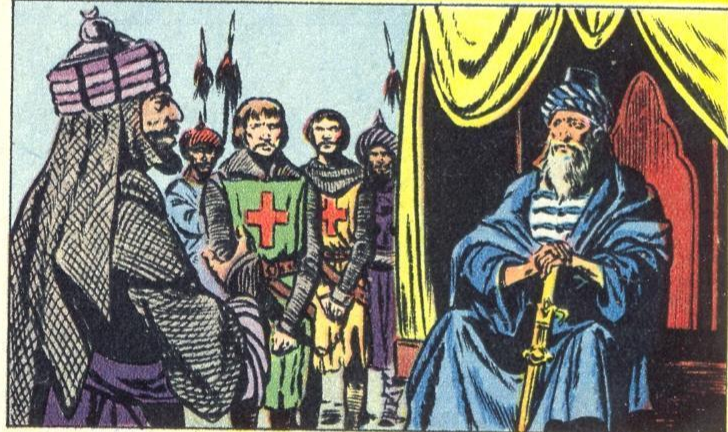
4. - SALADIN

HET grootste deel van de kruisvaarders keerde, na de inname van Jeruzalem, naar Europa terug. Men wachtte inderdaad sedert jaren op hen. Opdat de inname van Jeruzalem enig nut zou hebben, moest men de stad verder verdedigen tegen de Mohammedanen. Men maakte er een koninkrijk van en de koningen, van Belgische oorsprong, organiseerden het rijk op feodale wijze. Aan de zeden en de gebruiken van het Oosten pasten zij zich echter wonderwel aan.