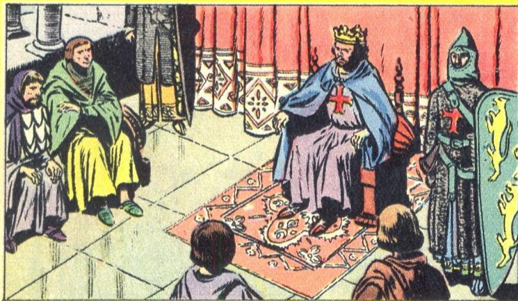
1. - EEN NIEUW RIJK

DE Turken gaven de strijd echter niet zo vlug op en weldra werd er in Europa een nieuwe kruistocht gepredikt om hen terug te werpen. Aan deze kruistocht nam Lodewijk VII van Frankrijk deel, evenals keizer Koenraad III. Diederik van den Elzas, graaf van Vlaanderen, rukte eveneens op. Hij kwam over zee tot vóór Lissabon, toen een Arabische stad die door de Portugezen belegerd werd. Hij waagde de aanval en veroverde de stad.