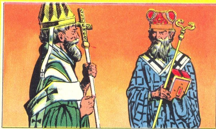
3. - ROME OF BYZANTIUM

DE middeleeuwen waren, zoals wij reeds hebben verteld, christelijk. Rome oefende een grote invloed uit en had veel gezag. De Kerk van het Oosten en de Kerk van het Westen waren nog één en dezelfde en toen kwam het schisma of grote scheuring. De Griekse Kerk of Ortodoxe scheidde zich af van de Latijnse of Rooms katolieke Kerk van het Westen. Dit is een heel triestige geschiedenis.