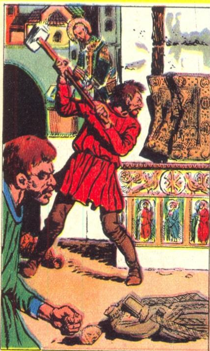
2. - DE BEELDSTORMERS

BYZANTIUM was een wereldstad en Rome was te dien tijde niets anders meer dan een stad vol puinen. In het midden van de IX e eeuw zette keizer Michael II Ignatius, patriarch van Constantinopel, af en verving hem door Photius, een listige en hovaardige leek. Photius werd in de ban geslagen, verjaagd, opnieuw bekleed met zijn waardigheid, weer geëxcommuniceerd... verbannen... Deze Photius had getracht paus Nicolas I af te zetten.