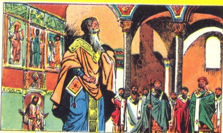
4. - PHOTIUS

DE verering van geschilderde of beeldhouwde beelden, die Christus, de Heilige Maagd of de heiligen voorstellen, werd goedgekeurd door de Kerk, want men vereerde niet het beeld zelf, maar de heilige die het voorstelde. De Kerk van het Oosten bezat prachtige beelden of iconen versierd met zilver en goud. De liturgische diensten hadden in het Oosten meer glans en luister dan in het Westen.