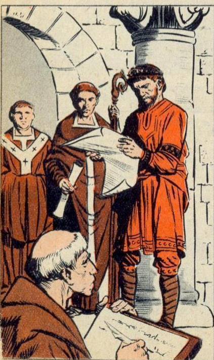
2. - HET DAGET IN DEN OOSTEN

KAREL de Dikke, afgezet in 887, werd opgevolgd door zijn neef Arnulf van Karinthië. Hij overwon de Noormannen te Leuven. Na hem werd Lodewijk III koning. Deze stierf in 911. Toen was het in Duitsland met de Karolingers gedaan. In 919 kwam Hendrik de Vogelaar, hertog van Saksen, op de troon die de invasie van de Hongaren, ook wel eens «Noormannen te land» genoemd, kon stuiten.