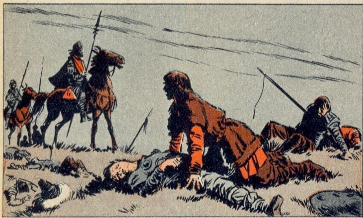
1. - DE HERTOGEN VAN SAKSEN