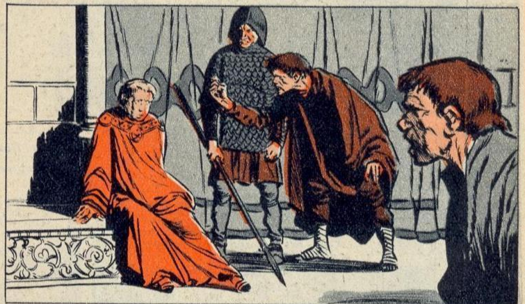
4. - DE PAUS IN NOOD

SEDERT de pausen een grondgebied bezaten, trachtten alle grote Romeinse families een van hun leden op de troon van sint Pieter te plaatsen. Dit gaf aanleiding tot veel moorddadige en betreurenswaardige twisten. Octavianus van Tusculum werd paus toen hij zestien jaar oud was onder de naam Johannes XII. Hij was tegen zijn taak niet opgewassen en riep Otto de Grote te hulp.