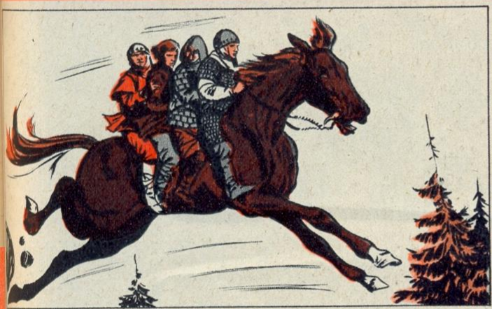
— DE TWEE BROEDERS.

T OEN Pepijn de Korte zich tot koning van de Franken liet uitroepen vestigde hij een nieuwe dynastie, de dynastie van de Austrasiërs. Deze naam ging nochtans niet in de geschiedenis, steeds spreekt men over de dynastie van de Karolingers. De oorsprong van deze naam ligt misschien bij Karel Martel, misschien bij Karel de Grote. Het is echter waarschijnlijk dat hij opdook met Karel de Kale, kleinzoon van Karel de Grote. De grootste en meest beroemde zoon van dit geslacht was ongetwijfeld Karel de Grote. De dynastie van de Karolingers regeerde tot op het einde van de tiende eeuw.