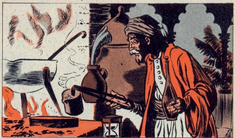
5. - GELEERDEN

D E Arabieren hebben ons prachtige kunstwerken nagelaten en in Spanje, waar zij gedurende zeven eeuwen domineerden, is hun invloed thans nog overal merkbaar. Zij maakten van Spanje een bloeiend land met prachtige moskeeën, zoals die van Toledo en Cordova. Het Alhambra, slot van de Moorse koningen, te Granada, met het Myrthenhof en het Leeuwenhof zo mooi dat het aan een sprookje doet denken.