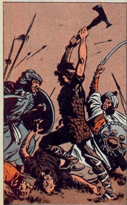
2. - DJEBEL-AL-TARIK

K HALIFA wil zeggen « vervanger ». De religieuze en politieke leiders van de Mohammedanen waren de plaatsvervangers van Mohammed. De eersten waren : Aboe-Bekr, Omar, Othman, Ali, schoonzoon van de profeet. Zij verbleven te Medina. Ali werd vermoord in 661 en Mu'awia, zoon van Ommeya, nam het bewind in handen. De troonopvolging werd nu erfelijk en de Ommeyaden regeerden gedurende twee eeuwen. Niet alle Mohammedanen wilden Mu'awia van Syrie erkennen zo kwam de scheuring in verschillende sekten waarvan sommigen thans nog bestaan.