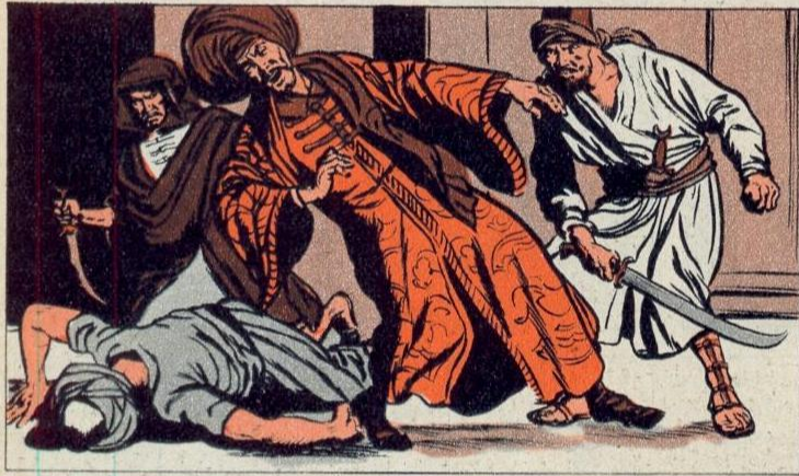
1. - KHALIFA

D JI-HAD betekent letterlijk « inspanning » en zo heet ook de « heilige oorlog » die de Mohammedanen oorspronkelijk moesten voeren tegen de ongelovigen of niet-Mohammedanen. Zij voerden die heilige oorlog zowel in het oosten als in het westen en het noorden en zij slaagden er in een stuk van Azie, heel Noord Afrika en een deel van het zuiden van Europa in te palmen. De Mohammedanen streden hardnekkig en fanatiek en waren verbazend sterk, ondanks het feit dat onderlinge twisten hun eenheid verscheurden.