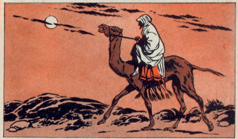
3. - DE STAD VAN DE PROFEET

OP het ogenblik dat de heilige Gregorius stierf en Europa christen was, werd er in Arabië een nieuwe godsdienst geboren : de Islam. De Islam werd voor het christendom een groot gevaar en meer dan eens dreigde het kruis vervangen te worden door de wassende maan. De Moesleimin, of Muzelmannen, of Mohammedanen, d. w. z. « getrouwen », zijn de volgelingen van MOHAMMED. Hun aantal bedraagt thans driehonderd vijftig miljoen !