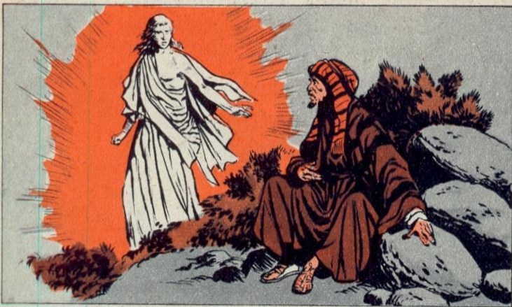
2. - ALLAH EN ZIJN PROFEET

MOHAMMED mediteerde veel, ontving rond 610 zijn eerste openbaring en begon te prediken. Hij zei o.m. : « God is één en onzichtbaar. Men moet blindelings geloven aan de wil van Allah, want alles staat geschreven ! ». Hij predikte ook het laatste oordeel en het toekomstig leven. Zijn dogmen werden geïnspireerd door de Joodse godsdienst, waarmee hij goed vertrouwd was.