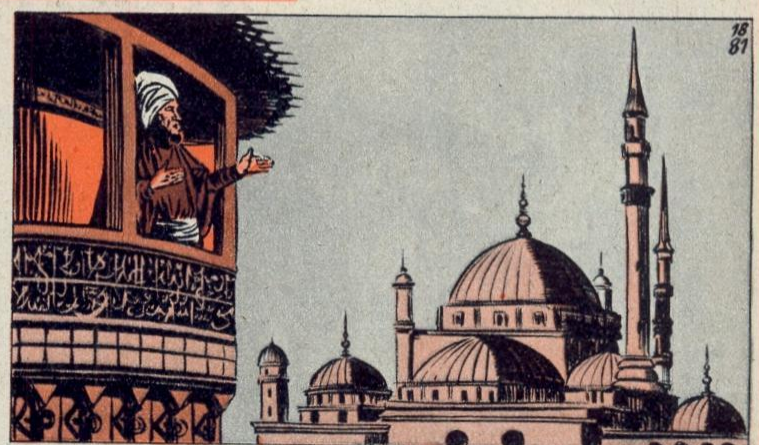
5. - DE TERUGKEER NAAR MEKKA

MOHAMMED mediteerde veel, ontving rond 610 zijn eerste openbaring en begon te prediken. Hij zei o.m. : « God is één en onzichtbaar. Men moet blindelings geloven aan de wil van Allah, want alles staat geschreven ! ». Hij predikte ook het laatste oordeel en het toekomstig leven. Zijn dogmen werden geïnspireerd door de Joodse godsdienst, waarmee hij goed vertrouwd was.