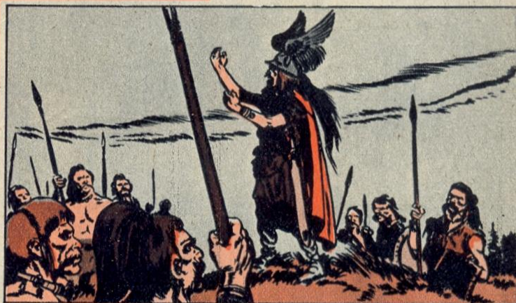
4. — TING

UNE nuit, Siegfried tout armé amena son fils loin du village. Ils arrivèrent à une immense place où des milliers de guerriers étaient réunis. « Le ting du gau ! dit Siegfried, l'assemblée de la tribu ! » Un guerrier chevelu et prodigieusement casqué parut. « Le König, dit Siegfried, le Roi ! ». Le Roi parla... Il parlait de guerre et de bravoure.