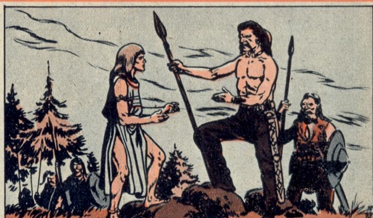
5. — « HERRMANN »

UNE nuit, Siegfried tout armé amena son fils loin du village. Ils arrivèrent à une immense place où des milliers de guerriers étaient réunis. « Le ting du gau ! dit Siegfried, l'assemblée de la tribu ! » Un guerrier chevelu et prodigieusement casqué parut. « Le König, dit Siegfried, le Roi ! ». Le Roi parla... Il parlait de guerre et de bravoure.