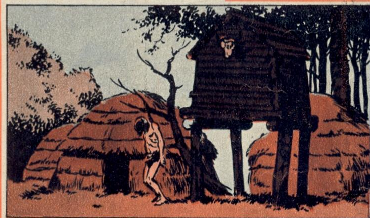
2. — FAIDAH