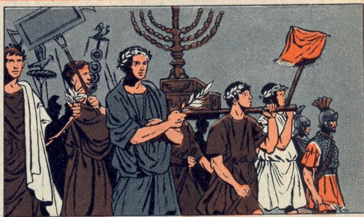
3. - DE PUINEN VAN JERUZALEM

D AT de politiek een echte rommelzooi kan worden is niemand onbekend. Te Rome was de toestand na de dood van Nero zó ernstig dat men er terecht voor vreesde dat het Romeinse rijk helemaal uiteen zou vallen en ten onder gaan. Maar op rampen en tegenspoed volgt er bijna steeds een energieke reaktie. Te Rome werd deze reaktie geïncarneerd door een stevige, kaalhoofdige boer die Vespasianus heette.