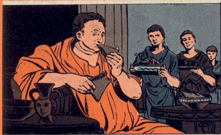
1. - DE WERELD IS EEN SCHOUWTONEEL...

D E Joden waren opgestaan tegen het gezag van Rome. Vespasianus belegerde hun hoofdstad, Jeruzalem, toen hij tot keizer werd gekozen. Hij droeg dan zijn zoon Titus de zorg op de belegering voort te zetten. Jeruzalem verdedigde zich hardnekkig, maar werd toch ingenomen en van de tempel «bleef er geen steen op steen». De schatten van de tempel werden door Titus in triomf meege dragen en de Joden naar de vier windstreken verspreid.