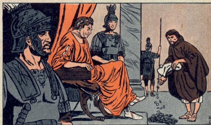
5. - DOMITIANUS

T ITUS had een broer die Domitianus heette en helemaal niet op hem geleeke. Hij regeerde vijftien jaar. In het begin ging alles goed, maar weldra liet Domitianus zijn waar geelaat zien. Hij was schijnheilig, hovaardig en wreed. Zijn wreedheid vond zijn oorzaak in het feit dat hij zo bang was. Een nieuw schrikbewind brak voor Rome aan. Niemand was nog veilig. Domitianus werd vermoord in 96 en de senaat vervloekte zijn nagedachtenis.