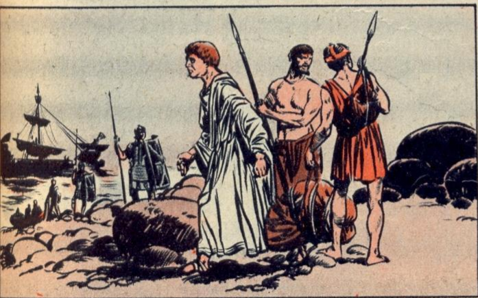
2. - PANIEK