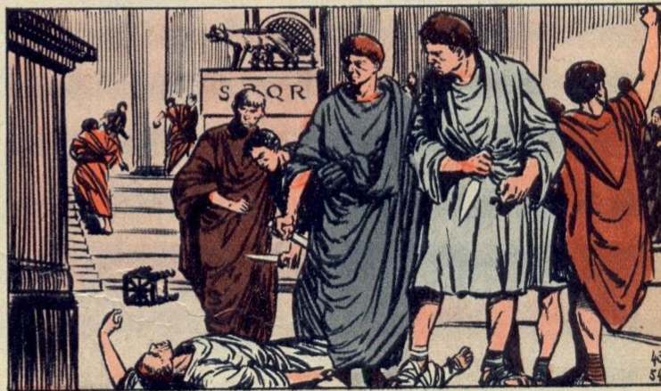
5. - GIJ OOK MIJN ZON!