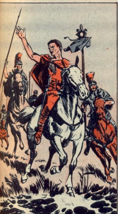
1. - OVER DE RUBICON