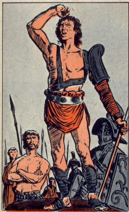
2. — UN ESCAMOTEUR

SYLLA était encore dictateur lorsqu'un jour se présenta devant lui un officier, nommé Pompée. Il avait remporté quelques médiocres succès et il demandait les honneurs du triomphe. Sylla refusa. « Prends garde, osa dire Pompée, que le soleil levant n'ait plus d'adorateurs que le soleil couchant ! ». Tout le monde resta consterné. Impressionné par tant d'audace, Sylla s'écria : « Eh bien, soit ! Qu'il triomphe ! ». Pompée allait monter, monter très haut.