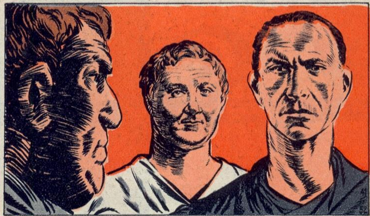
5. — LE PREMIER TRIUMVIRAT

REVENU d'Asie, Pompée avait commis l'erreur de licencier son armée et de revenir à Rome seul. Il y trouva Jules César. César avait 40 ans. Grâce à ses largesses, il était maître de la démocratie. Prodigieusement intelligent, il avait une ambition dévorante. On l'avait vu pleurer devant la buste d'Alexandre le Grand en disant : « A trente ans, il avait conquis le monde et moi, je n'ai encore rien fait ! ».