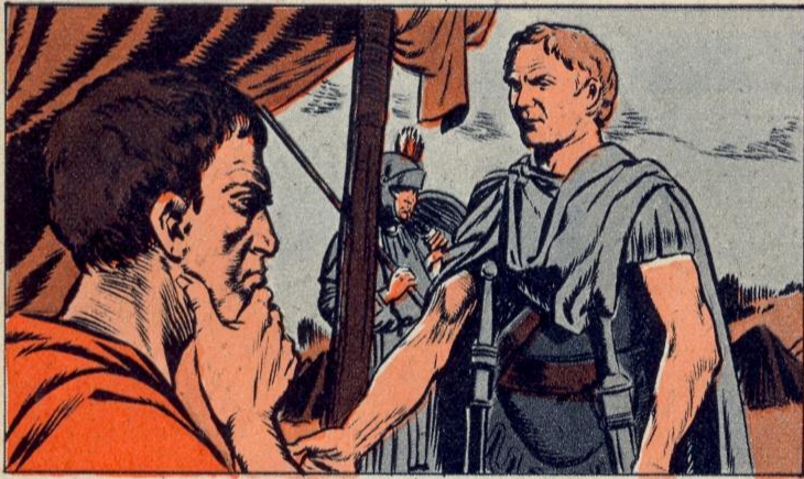
1. — « LE SOLEIL LEVANT »

L A guerre du jambon continue ! Après Marius et Sylla, Pompée et César... Ils étaient tous les deux ambitieux, puissants et intelligents. Etant donné les atouts respectifs dont ils disposaient l'un et l'autre, on pouvait craindre que Rome ne fit les frais de leur rivalité. Heureusement, il n'en fut rien. Après s'être longtemps mesurés du regard, après avoir esquissé quelques passes d'armes, les adversaires finirent par se tendre la main. Mais le cœur n'y était pas !