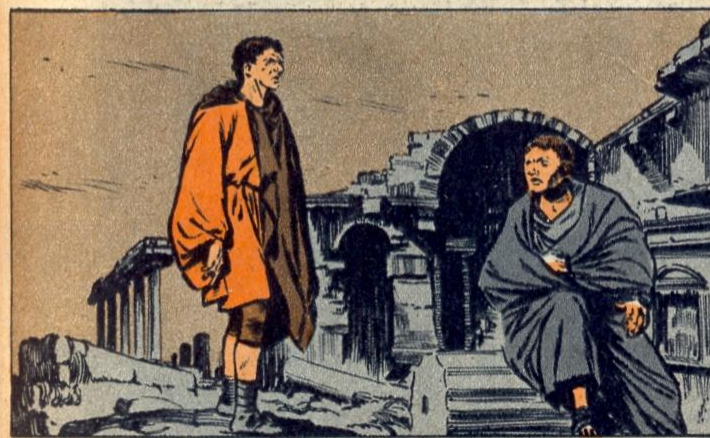
2. - HET GAAT SLECHT VOOR MARIUS