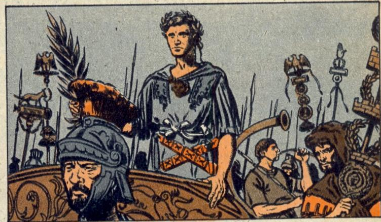
4. - DE TERUGKEER VAN DE OVERWINNAAR