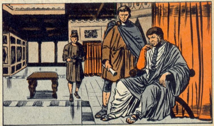
3. - IN HET HOL VAN DE LEEUW